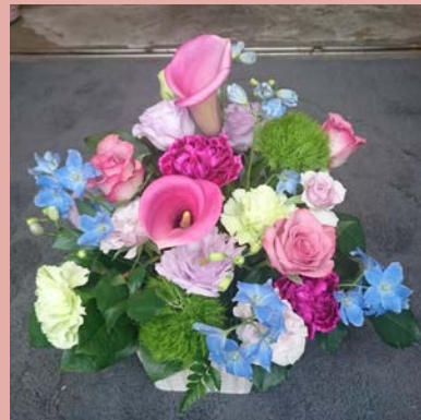
M06 <生花アレンジメント>