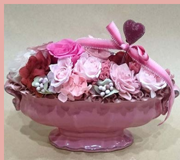
M08 <プリザーブドフラワー>