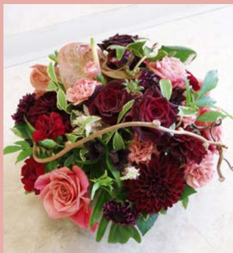
M05 <生花アレンジメント>