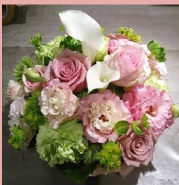
M04 <生花アレンジメント>